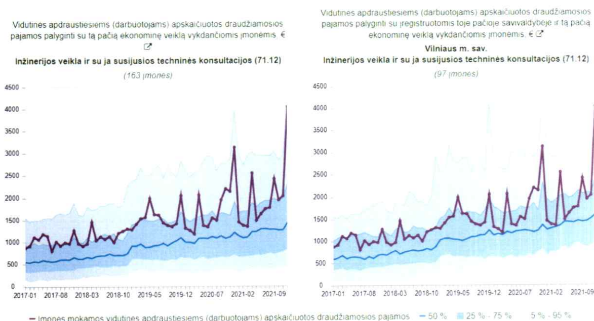
2 pav. Vidutinis darbo užmokestis inžinerijos veiklą vykdančiose ir su ja susijusias technines konsultacijas teikiančiose įmonėse

Pastaba: 50% žymima lyginamų įmonių vidutinių darbo užmokesčių mediana